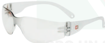
Ref: AL173 ICARO CLARA

Cod: 703-29-199 | Talla: Única ▶ Sencilla