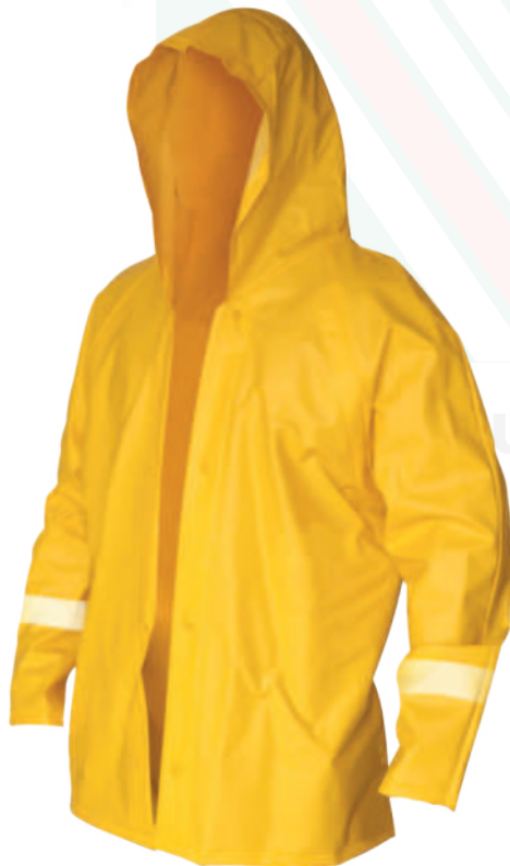
Cod: 705-5-1 Calibre 18