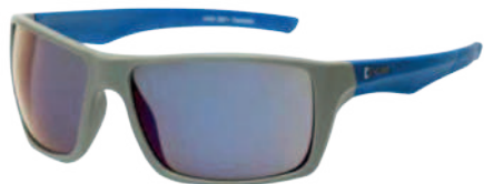
Ref: GB9398 HERMES REVO BLUE

Cod: 703-48-11 | Talla: Única ▶ Oscura Espejada