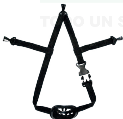
BARBUQUEJO TRES PUNTOS

Talla: XS/S/M/L/XL/XXL/XXXL Cod: 707-20-63