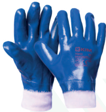
Ref: J7 67K FURNAX