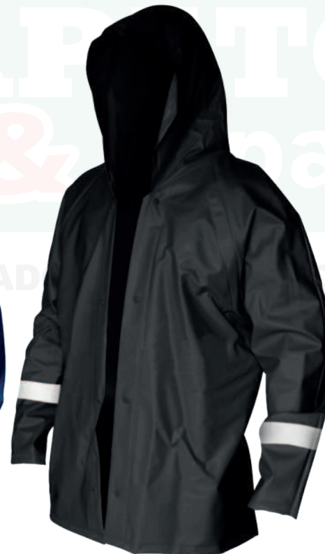
Cod: 705-5-7 Calibre 18