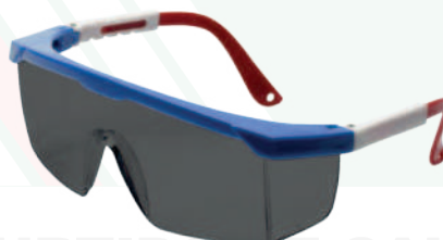
Ref: ALO26 AQUILES OSCURA

Cod: 703-29-199 | Talla: Única ▶ Sencilla