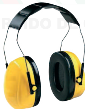
Ref: DEREB PROTECTOR AUDITIVO METÁLICO

TODO UN SURTIDO DE CALZADO DE... E DOTACION