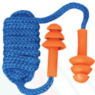
Ref: APOLO PROTECTOR AUDITIVO

Cod: 704-73-68 | Talla: Única ▶ En Silicona