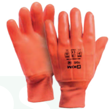
FIDIO TÉRMICO EN PVC NEÓN