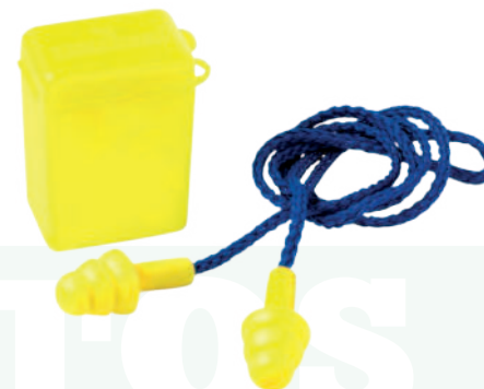
Ref: APOLO PROTECTOR AUDITIVO

Cod: 704-2-63 | Talla: Única ▶ Inserción