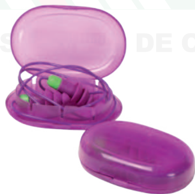
Ref: CENTAURO PROTECTOR AUDITIVO

TODO UN S... DE CALZADO DE MODA... ROTACION