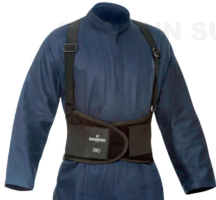
FAJA SOPORTE LUMBAR