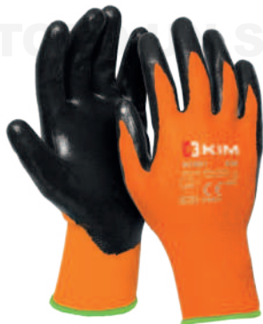
Ref: N1001 T9 CORUS NITRILO