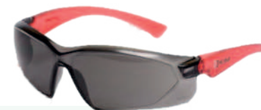
Ref: AL238 MINOTAURO OSCURA

Cod: 703-23-7 | Talla: Única ▶ Antiempañante