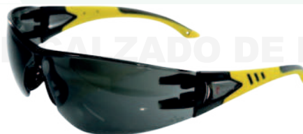
Ref: GB9405 ELECTRA YELLOW OSCURA