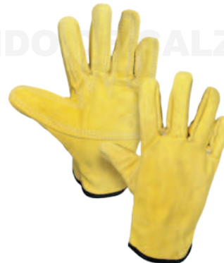
GUANTE CORTO VAQUETA Cod: 701-60-1 | Talla: Única ▶ Reforzado