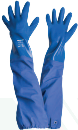
Ref: T9 NEPTUNO

Cod: 701-22-11 | Talla: L/XL ▶ Largo PVC