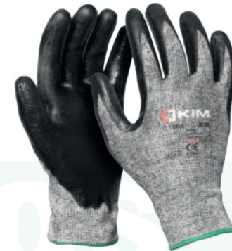
Ref: C1004 NERIO

Cod: 701-103-6 | Talla: M/L/XL ▶ Acero Inoxidable