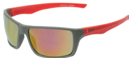
Ref: GB9398 HERMES REVO RED

Cod: 703-48-11 | Talla: Única ▶ Oscura Espejada