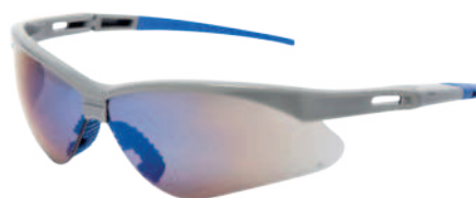
Ref: ALO78 PERSEO REVO BLUE

Cod: 703-41-11 | Talla: Única ▶ Oscura Espejada