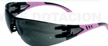
Ref: GB9405 ELECTRA PURPLE OSCURA