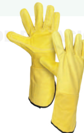
GUANTE LARGO VAQUETA Cod: 701-62-1 | Talla: Única ▶ Reforzado