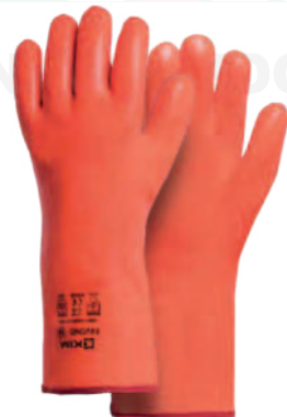
FAVONIO TÉRMICO PVC NEÓN