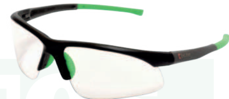
Ref: GB9310 PERSEO EUROPA CLARA