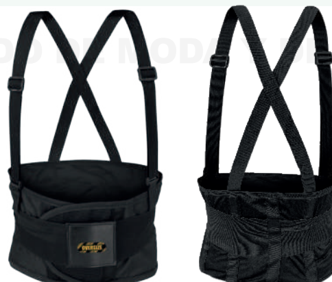
FAJA ECONÓMICA PRODUSEG