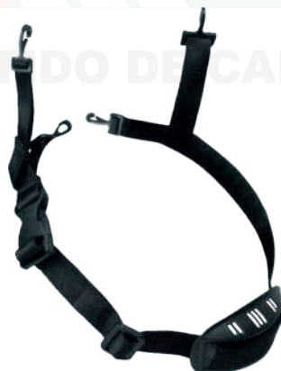
BARBUQUEJO CUATRO PUNTOS