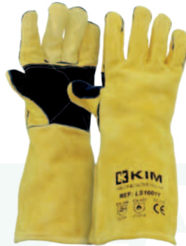
Ref: LS1001Y HÉRCULES

Cod: 701-99-18 | Talla: Única ▶ Soldador