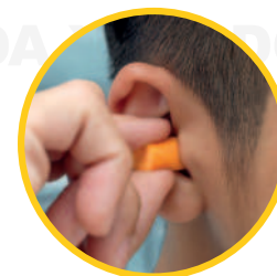
Ref: ESPUMA INO PROTECTOR AUDITIVO