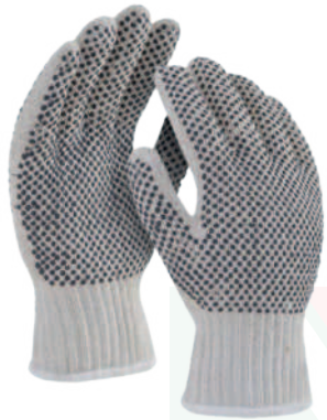
CONVECTOR NYLON POLIÉSTER CON PUNTOS Cod: 701-6-3 | Talla: Única ▶ De PVC Dos Caras