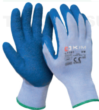
Ref: L1101 T9 ISSA HILAZA

Cod: 701-96-6 | Talla: M/L/XL ▶ Anticorte