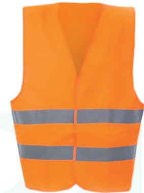
CHALECO THORA REFLECTIVO