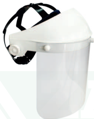
CASCO CARETA EN PVC