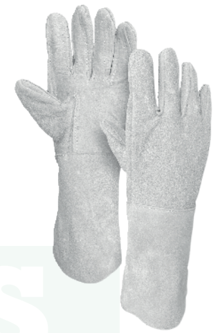
GUANTE LARGO CARNAZA Cod: 701-29-6 | Talla: Única ▶ Reforzado