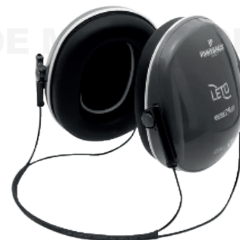
Ref: LETO PROTECTOR AUDITIVO METÁLICO

Cod: 704-1-1 | Talla: Única ▶ De Diadema