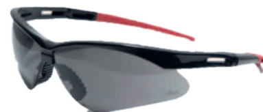
Ref: ALO78 PERSEO OSCURA

Cod: 703-41-11 | Talla: Única ▶ Oscura Espejada