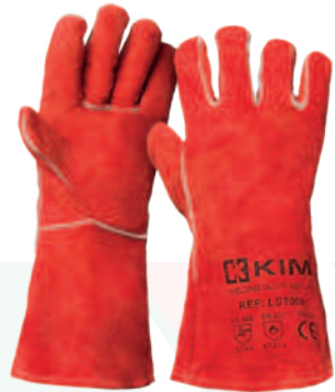
Ref: LS1006 VULCANO

Cod: 701-99-18 | Talla: Única ▶ Soldador