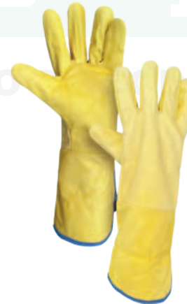
GUANTE LARGO VAQUETA Cod: 701-29-1 | Talla: Única ▶ Sencillo