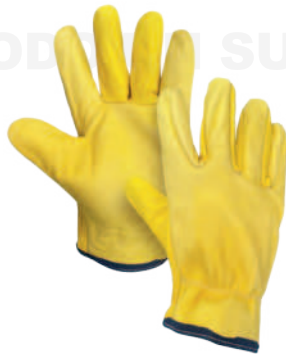
GUANTE CORTO VAQUETA Cod: 701-31-1 | Talla: Única ▶ Sencillo