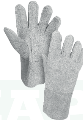
GUANTE CORTO CARNAZA Cod: 701-34-6 | Talla: Única ▶ Reforzado