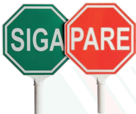
SEÑALIZACIÓN SIGA Y PARE