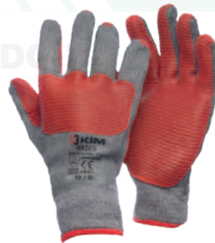
Ref: HADES LAMINATED GLOVE HILAZA

Cod: 701-27-11 | Talla: M/L/XL ▶ Látex Issa