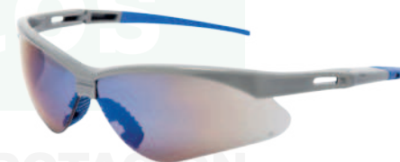
Ref: ALO78 PERSEO REVO BLUE

Cod: 703-42-199 | Talla: Única ▶ Sencilla