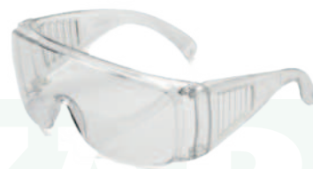
Ref: AL1428 EOS CLARA