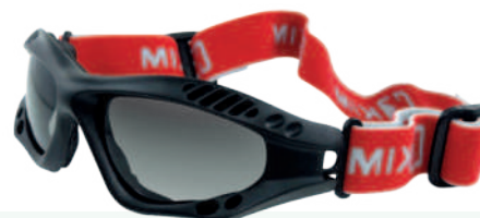
Ref: GB9317 ODISEO LENTE OSCURO

Cod: 703-48-18 | Talla: Única ▶ Oscura Espejada