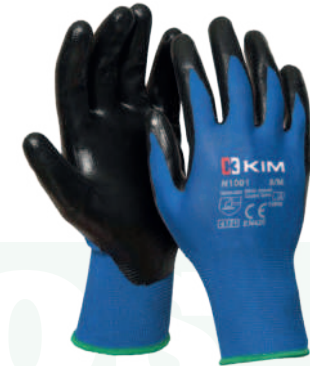
Ref: N1001 T9 CORUS NITRILO

Cod: 701-64-11 | Talla: M/L/XL ▶ Polinylon Espumado