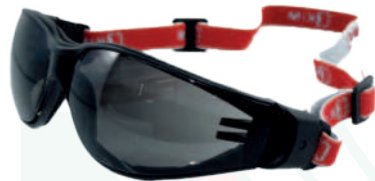
Ref: AL173 ICARO OSCURA