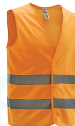
CHALECO ECONÓMICO REFLECTIVO

Talla: XS/S/M/L/XL/XXL/XXXL Cod: 707-20-63