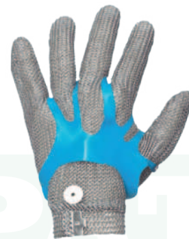
Ref: MESSOR MALLA

Cod: 701-103-6 | Talla: M/L/XL ▶ Acero Inoxidable