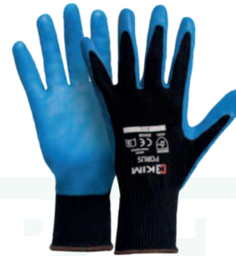
Ref: C22DBJS-F PORUS

Cod: 701-104-7 | Talla: M/L/XL ▶ Touch Screen