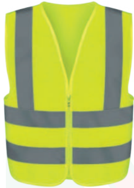
CHALECO FUNCIONAL RODHIA