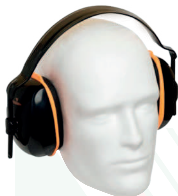
Ref: B020 PROTECCIÓN AUDITIVA