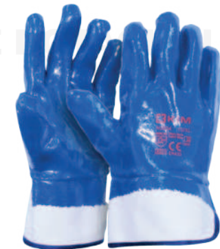
Ref: N3203 ARES NITRILO

Cod: 701-106-63 | Talla: M/L/XL ▶ Con Resistencia Química