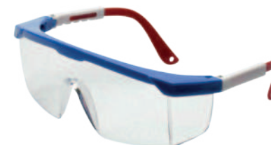
Ref: ALO26 AQUILES ANTIEMPAÑANTE