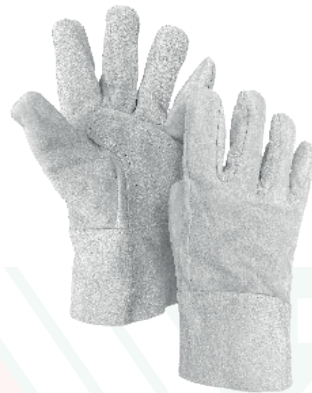
GUANTE CORTO CARNAZA Cod: 701-32-6 | Talla: Única ▶ Sencillo