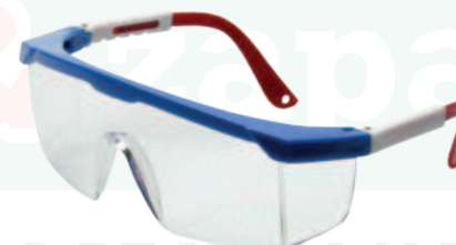
Ref: ALO26 AQUILES CLARA

Cod: 703-42-199 | Talla: Única ▶ Sencilla