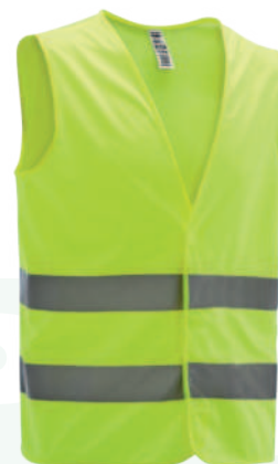
CHALECO ECONÓMICO REFLECTIVO

Talla: XS/S/M/L/XL/XXL/XXXL Cod: 707-20-63