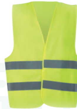
CHALECO THORA REFLECTIVO