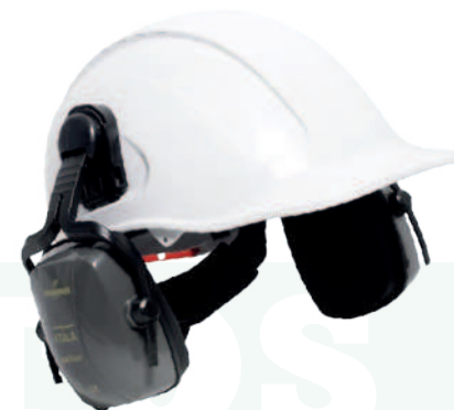
Ref: ATALA PROTECTOR AUDITIVO METÁLICO

Cod: 704-4-63 | Talla: Única ▶ De Inserción a Casco