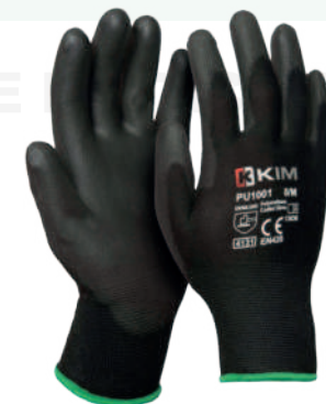
Ref: PU1001 FEBE

Cod: 701-95-1 | Talla: L/XL ▶ Poliéster Látex