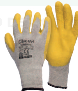
Ref: C12CHLYB MINERVA

Cod: 701-94-18 | Talla: XL ▶ Vulcanizado