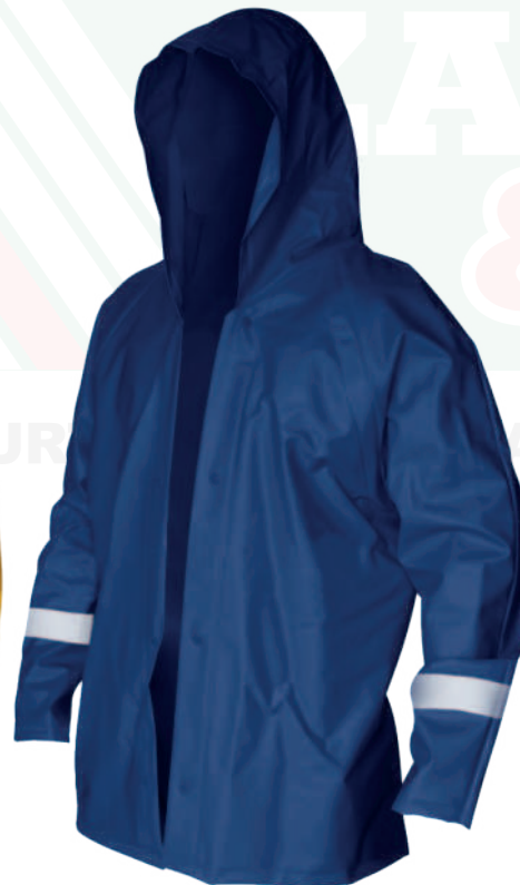
Cod: 705-5-11 Calibre 18