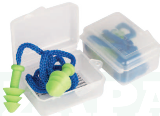
Ref: WPOASP500 TAPA OIDOS DELTAPLUS

Cod: 704-73-68 | Talla: Única ▶ En Silicona