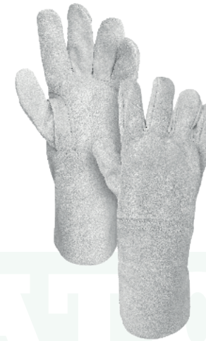
GUANTE LARGO CARNAZA Cod: 701-30-6 | Talla: Única ▶ Sencillo