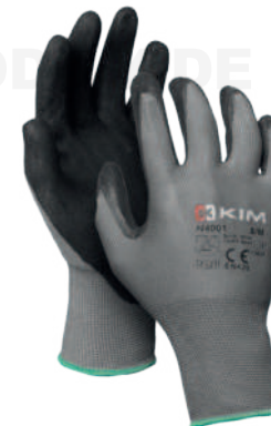
ORCUS POLIÉSTER RECUBRIMIENTO