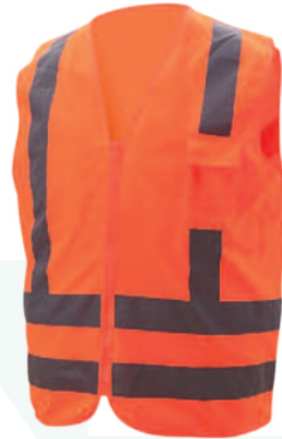
CHALECO FUNCIONAL RODHIA