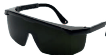
Ref: ALO26 AQUILES GRADO 5,0

Cod: 703-41-7 | Talla: Única ▶ Oscura Espejada