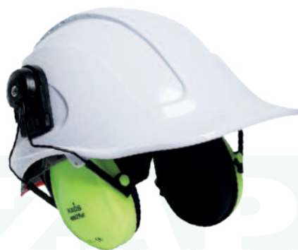
Ref: KAUS PROTECTOR AUDITIVO METÁLICO

Cod: 704-4-63 | Talla: Única ▶ De Inserción a Casco