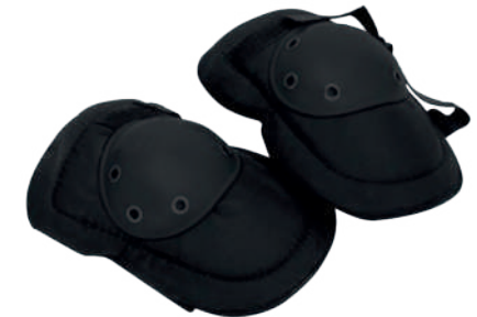
PROTECTOR DE RODILLAS