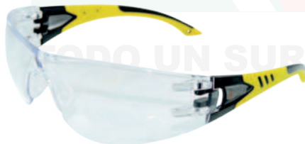
Ref: GB9405 ELECTRA YELLOW CLARA